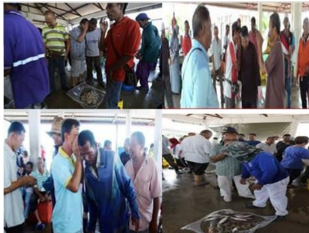
Gambar: Suasana transaksi jual beli di Pasar Bisik Kuala Muda, Kedah

Dari amalan jualan lelong yang dilakukan secara bisik tadi menimbulkan persoalan di kalangan masyarakat yang menganggap bahawa praktek jualan lelong ini tidak sah kerana tidak memenuhi rukun dan syarat jual beli serta mengandungi elemen-elemen yang ditegah oleh syarak seperti saum, gharar, riba dan curbun yang boleh dianggap dapat merosakkan kesahihan akad lelong tersebut. Hipotesis ini belum dapat dipastikan kebenarannya sehinggalah dilakukan kajian ke atasnya. Oleh yang demikian tulisan ini akan memberikan ulasan atau pandangan syarak baik secara umum ataupun khusus terhadap cara dan tradisi yang diamalkan dalam jual beli lelong secara bisik.