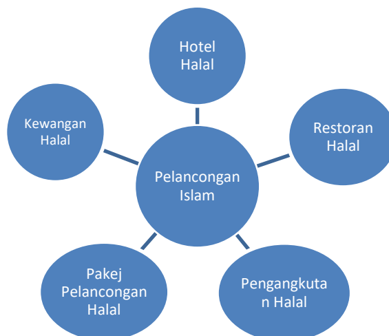
Rajah 1 Lima Komponen Utama Pelancongan Islam Yang Perlu Diberi Keutamaan. – Laporan OIC dan SESRIC (2017)