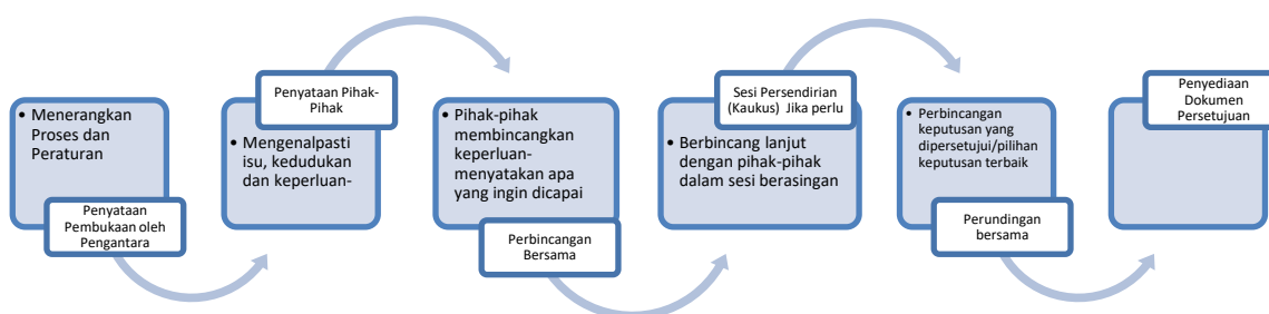
Carta 1: Proses Mediasi, Pusat Mediasi, Majlis Peguam Malaysia

Bagi memastikan proses yang dilaksanakan dalam Majlis Sulh adalah jelas, tersusun dan seragam, Manual Kerja Sulh telah dibangunkan berdasarkan proses asas mediasi. Secara dasar, susunan cadangan pengendalian prosesnya adalah seperti proses mediasi umum.